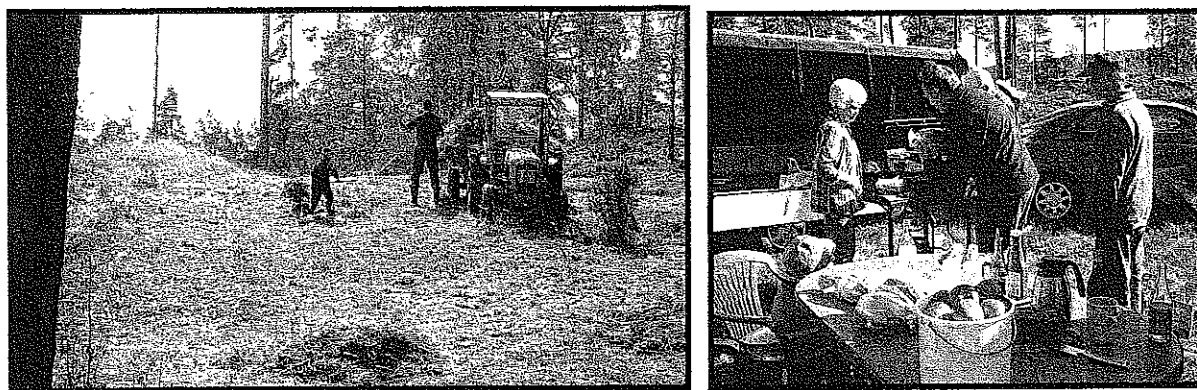
Alla hjälper till efter bästa förmåga – och trivs!

LÖRDAG 10:E SEPTEMBER KLOCKAN 09 – CA 13